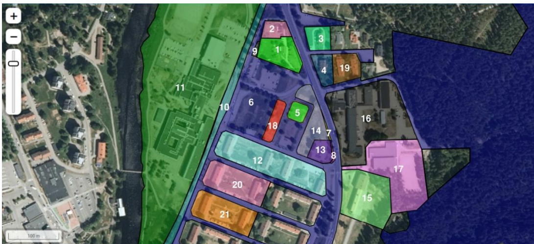
Bild 2 Fastigheter för samrådskrets

I Bild 2 Fastigheter för samrådskrets visas de fastigheter som berörs av samråd markerade med en numrering från 1-21.