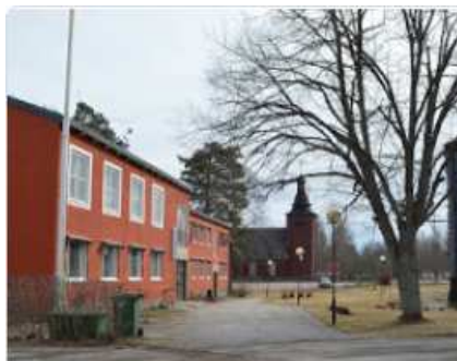
Träd 6. Vår ovan och höst nedan.