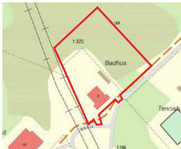
Översikt över planområdet inringat i rött (Lantmäteriet 2018)

Planområdet innefattar hela fastigheten Grinnemo 1:323 (f.d. badhuset) som ägs av Emanuelssons Åkeri i Ekshärad AB), delar av fastigheten Grinnemo 1:189 (naturmark) samt Grinnemo 1:188 (gatumark) vilka båda ägs av Hagfors kommun. Planområdet är cirka 1,4 ha.