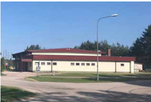
Det före detta badhuset sett från Skolvägen

I planförslaget föreslås att det inom området kan etableras icke störande verksamhet och kontor ( ZK ). Med detta avses verksamheter med en begränsad omgivningspåverkan som garage, bilverkstad eller motsvarande. Enligt Boverkets Allmänna råd 2014:5 om planbestämmelser för detaljplan (4:20), bör Z tillämpas för service, lager, tillverkning med tillhörande försäljning, handel med skrymmande varor och andra verksamheter med likartad karaktär med begränsad omgivningspåverkan. Exempelvis lokaler för serviceverksamheter, tillverkning, lager och verkstäder, fordonsservice, bilprovning, lokaler för material eller utrustning eller hushållsnära tjänster. I användningen ingår komplement som parkering och kontor, men drivmedel och drivmedelsförsäljning ingår inte i Z. Användning Z innebär att verksamheter som i begränsad utsträckning avger lukt, buller, ljusstörningar