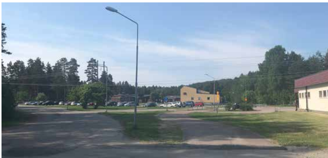
Bild tagen från GC-vägen söder om planområdet. Byggnaden inom planområdet till höger i bild med utblick över skolan med parkering framför samt kraftledningen som passerar där över.