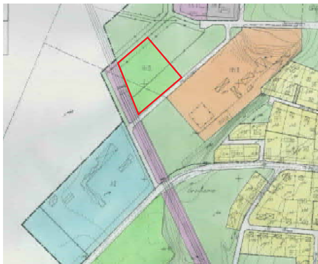
Gällande plan med aktuellt planområde inringat i rött

Planområdet omfattas idag av Byggnadsplan för tätorten Kyrkheden (laga kraft 1973-10-18). Området där det före detta badhuset ligger har bestämmelsen Ri-område för idrottsändamål.